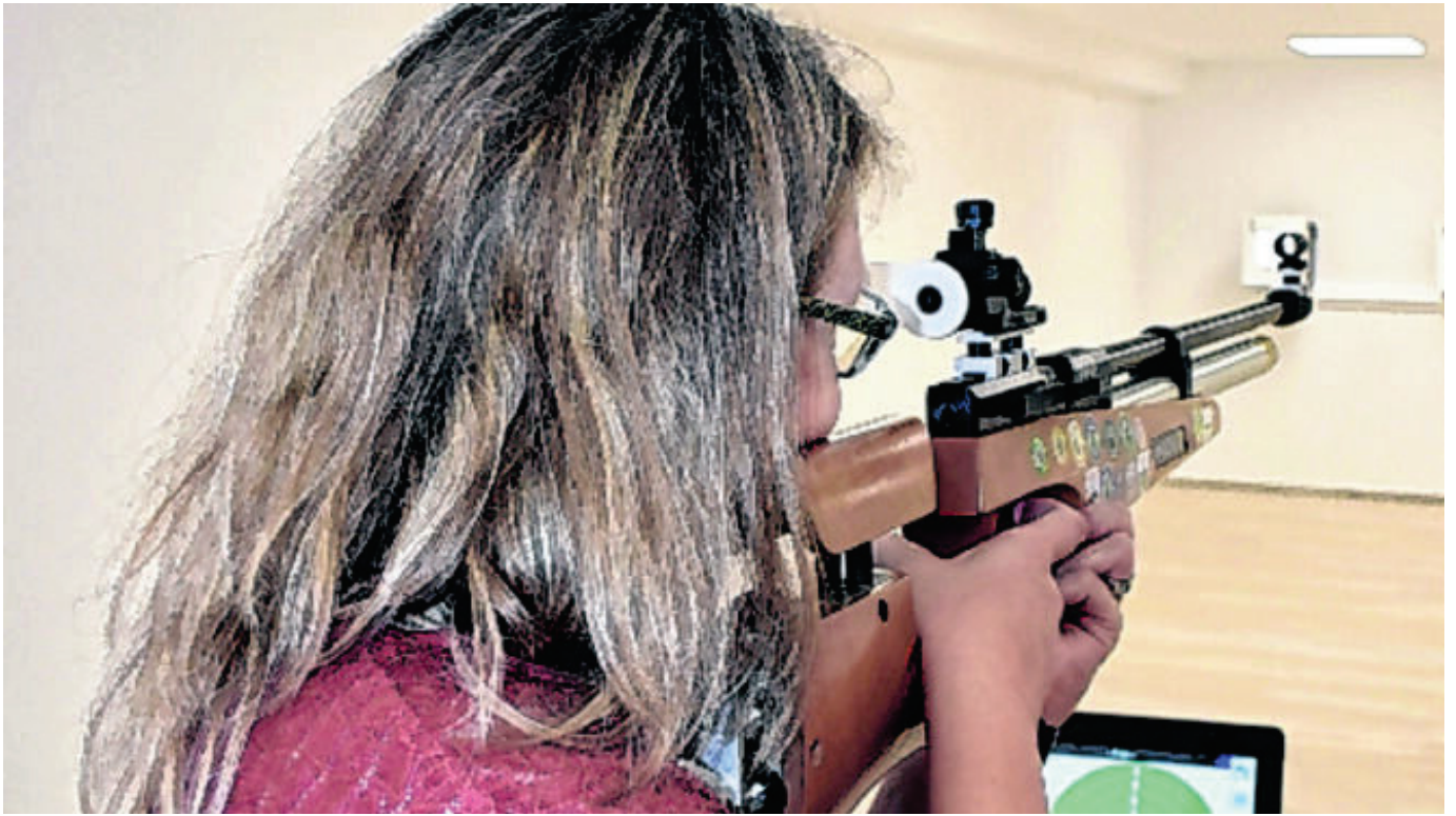
Beim Tag der offenen Tür in Waal war sowohl beim Schießen...